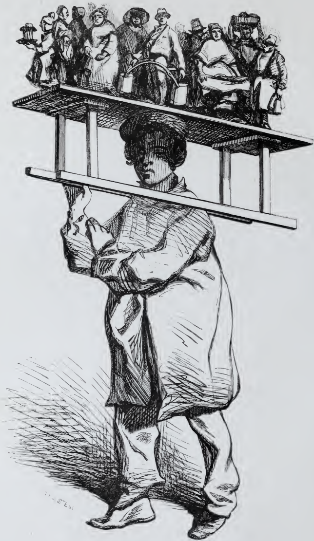
Le Marchand de Statuettes.